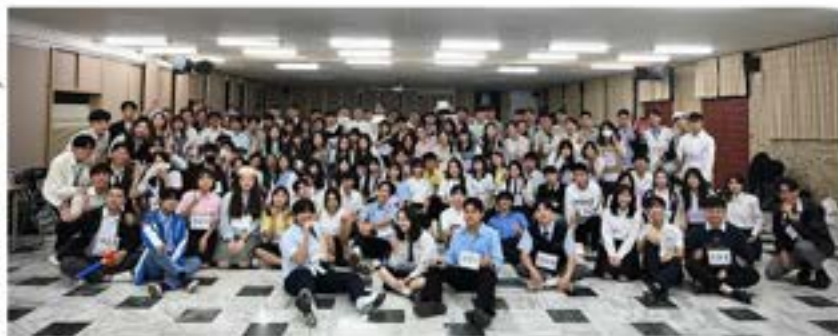
▲高中制服派對大合影

2023年11月24日法律系學會與醫學系學會、宗教系學會攜手合作，舉辦了一場別開生面的高中制服派對。三系同學穿上各種款式的高中制服，彷彿回到了青澀的校園時光。這場高中制服派對充滿了趣味和獨特的視覺效果，打破學科領域的界限，讓不同學系的同學們有機會認識與交流，期待未來在大學生涯中共同學習和成長。