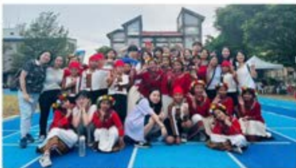
▲2023 台東健康服務營「醫」「法」攜手行

每天活動的開始，同學們陪伴小朋友寫暑假作業及學習英文課，完成就可以參加大地遊戲，下午安排衛生教育與法治宣導課程。衛教組的課程包含：健康與均衡飲食、自我身體認識、視力保健、口腔衛生等，法官組則包含：家庭暴力、友善校園-霸凌、性騷擾-作自己的主人、偷竊-防盜小能手等。課程依高年級與低年級分班，設計不同的內容與活動，今年首次嘗試醫學院與法律學院混合分組，讓彼此的專業互相激盪，同時也讓同學相互學習。五天的陪伴其實真的很短，但原住民孩子的善良純真，對於大哥哥大姐姐們的付出、鼓勵與陪伴，總是慷慨地回報，畫像、謝卡、讚美與感謝源源不絕，唯願我們的相遇，成為孩子們人生起跑路上的一束星光，繼續陪伴與照亮他們！