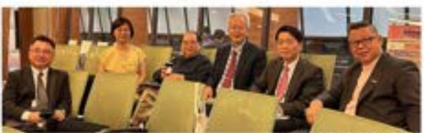
▲綜合座談學者合照