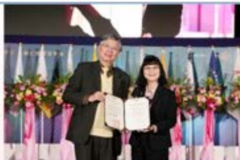
▲江漢賢校長致贈傑出校友證書予陳月端學姐

陳月端學姐 1983 年畢業於法律學系法學組，110 學年度獲推薦為本院傑出校友，112 學年度更榮獲輔仁大學學術卓越類傑出校友。陳學姐現任國立高雄大學校長，身為高雄大學創校 20 年來首位女性校長，自就任校長起積極推動校務與產業各界之連結，致力培養學生在專業方面之外的跨域能力，運用團隊研發量能，善盡中型區域大學社會責任，成為南臺灣高等教育特色大學，以典範的改變理念帶領團隊開創新局邁向永續。