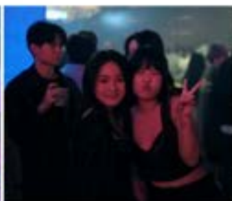
▲聯合耶誕舞會合影