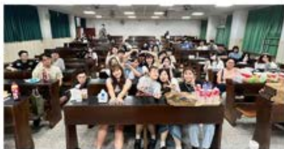
▲法律學系進修學士班迎新茶會

2023年9月20日法律學系進修學士班系學會於校內舉辦112學年度迎新茶會活動，希望藉由迎新團康熱鬧的氣氛拉進彼此間的距離，透過簡單的遊戲讓新生快速找到自己的直屬學長姐，以增加系上的向心力、增進團體默契，促使法律系同學間情感上更為緊密。