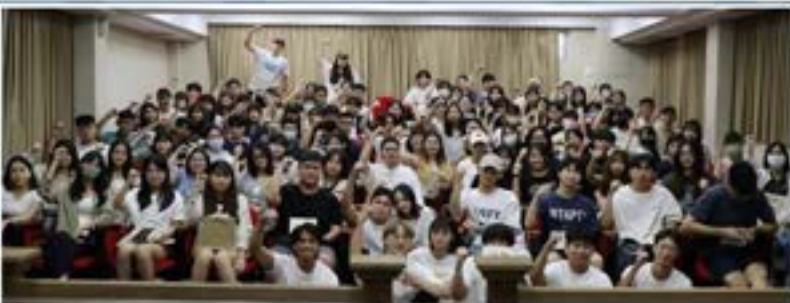
▲迎新茶會參與者大合照

2023年9月10日法律系學會在新學年揭開序幕之際，舉辦了一場熱情洋溢的迎新茶會，歡迎新生加入這個充滿活力的大家庭。活動一開始，系學會幹部致詞歡迎新生的加入，並鼓勵他們融入法律系的大家庭，共同度過豐富多彩的大學生活。接著，舞台上出現了各種有趣的表演，包括新生各式的才藝展示，吸引了現場的掌聲不斷。迎新茶會的一大亮點是互動環節，學會特地籌備了系列趣味遊戲，讓新生們更好地相互認識並建立友誼。從小組競賽到知識問答，每個環節都充滿歡笑聲和競爭激烈。同時，學會的資深成員也在場分享他們的經驗，解答新生對法律系學習和生活的種種疑慮。迎新茶會的尾聲，大家一起拍攝了大合照，學會成員與新生們互動交流，建立起友誼的種子，共同度過了一個充滿歡笑和互動的下午。法律系學會的迎新茶會不僅拉近了新生與學會成員之間的距離，也為新學年的學業和活動打下了一個充滿正能量的開始。期待這群新生在法律的征途上茁壯成長，並與學會一同創造更多精彩的回憶。