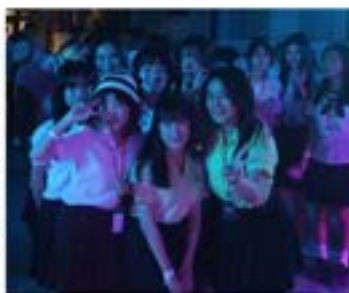
▲五系聯合制服活動合影

2023年11月24日財法、經濟、生科、醫資、及德文系學會於潛水艇的天空舉辦聯合制服趴，讓大一新生們能重拾高中制服，在新的大學環境中，結交來自系內和系外的朋友。